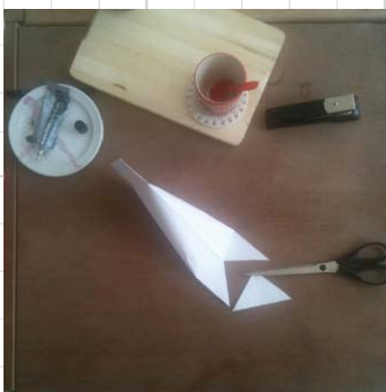
7. knip aan één kant een staart uit het gelijmde flapje