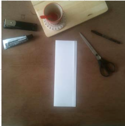
2. vouw het vel in de lengte doormidden, maar houd een plakstrip over