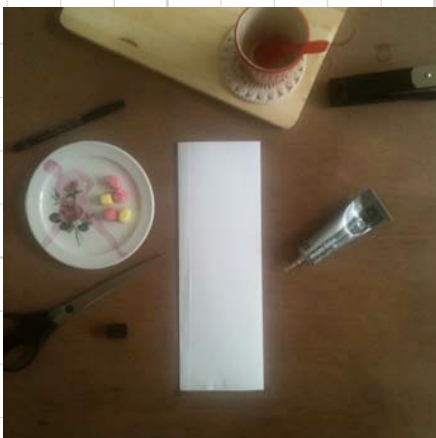
4. laat goed drogen, en lijm/niet 1 kant dicht, tot een stevig zakje,