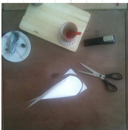
8. knip aan de andere kant een vissenhoofd uit het gelijmde flapje