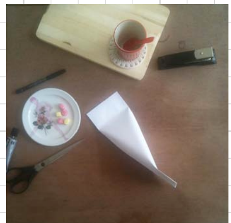
6. lijm/niet de open kant dicht. Laat goed drogen!