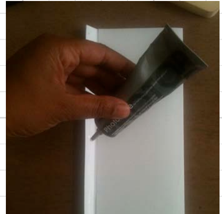
3. plak de strip vast met fotolijm