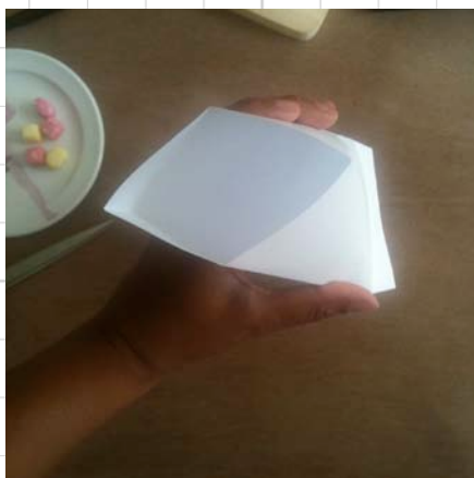
5. duw het zakje voorzichtig tot een driehoeksvorm en vul met snoepjes,