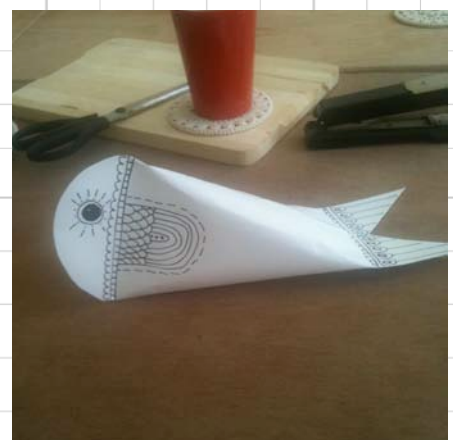
9. teken met een zwarte stift oogjes en schubben op de vis!