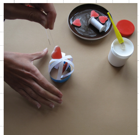
9. lijm de witte stroken aan de binnenkant van de blauwe cirkel - klaar!