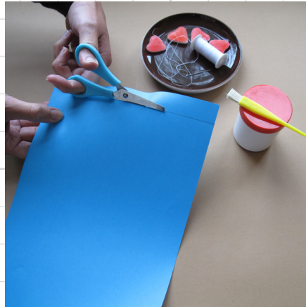
2. knip van het blauwe vel een strook van ongeveer een centimeter