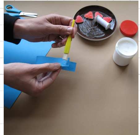
3. vorm van de strook papier een ring en lijm vast