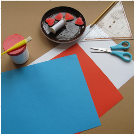
1. neem een paar vellen gekleurd papier

Een superleuke en makkelijke traktatie. De kinderen kunnen helpen met snoeprijgen.