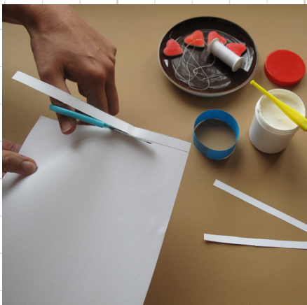
4. knip 3 iets dunnere stroken van het vel witte papier