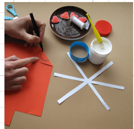
6. vouw een hoekje van het rode papier om en teken een vogeltje