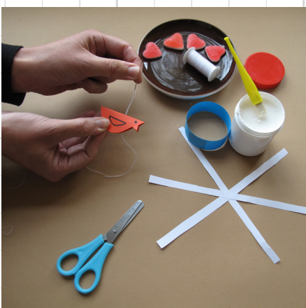
7. knip het vogeltje uit en teken een vleugel en een oogje. rijg de vogel aan een draad en lijm dicht