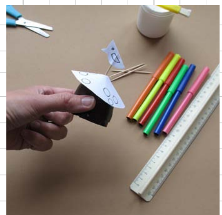
9. prik het prikkertje door het paddestoelenhoedje en... klaar!