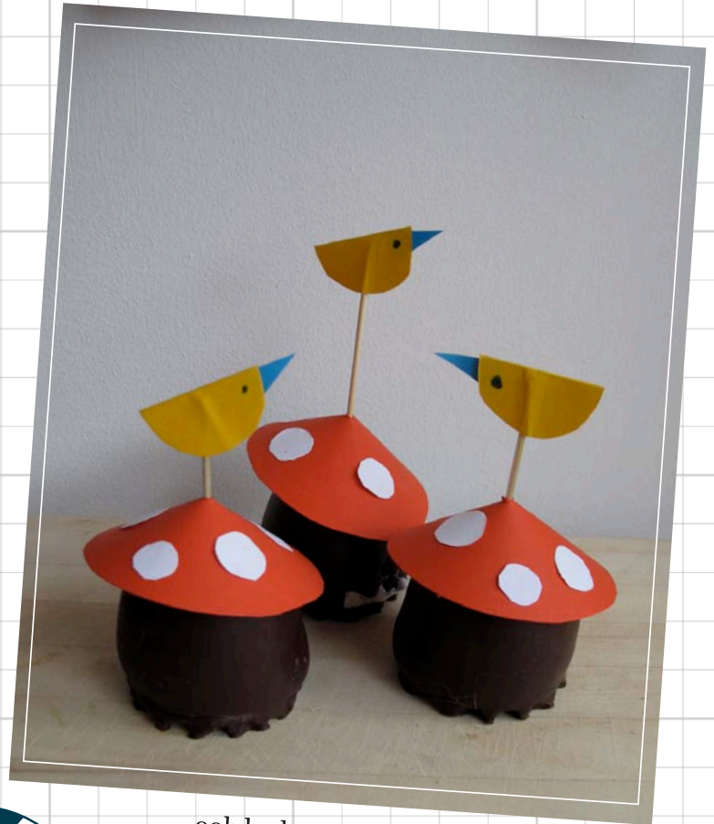
....ook leuk met wit papier!