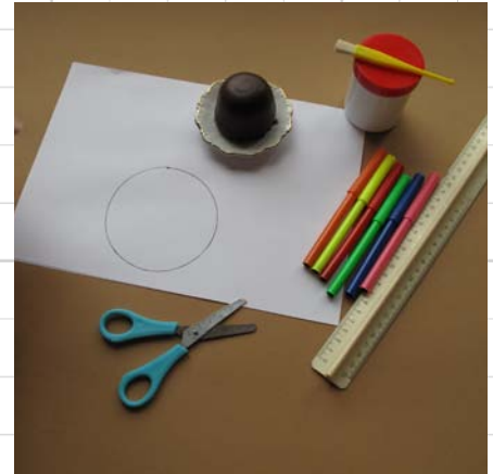
3. de cirkel moet iets groter zijn dan je traktatie (hier een choco-zoen)