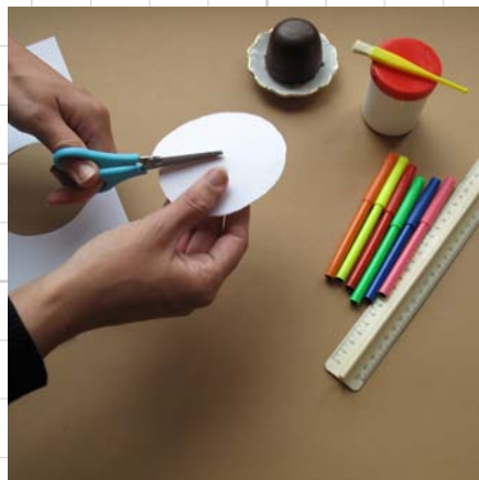
5. knip in (ongeveer tot het midden)