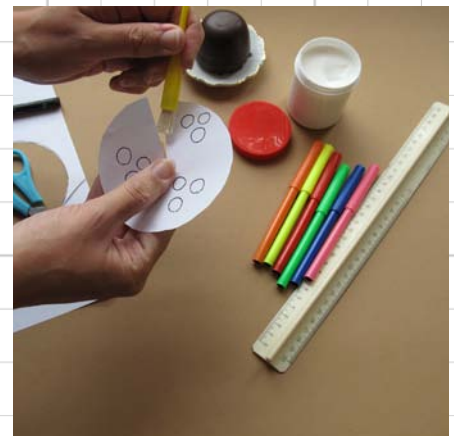
6. teken stipjes, vouw tot hoedje en lijm vast