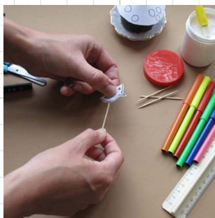
8. steek de cocktailprikker tussen het vogeltje en lijm vast