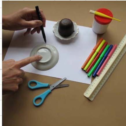
2. teken een cirkel