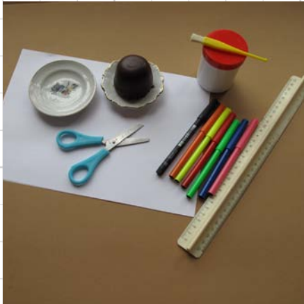
1. pak een leeg A4-vel

Een superleuke en makkelijke traktatie. De kinderen kunnen helpen met kleuren en plakken!