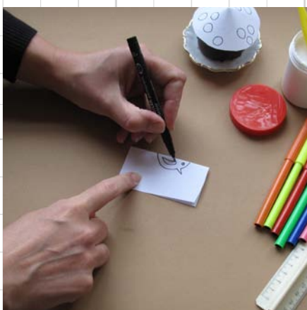
7. vouw een klein stukje papier dubbel en teken hierop een vogeltje en knip nu netjes uit (houdt het papiertje dubbelgevouwen!)