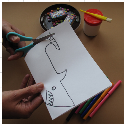
5. knip de haai uit - let op dat je het vel doormidden gevouwen houdt