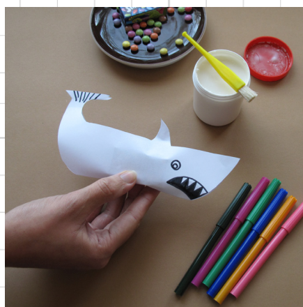
8. laat de lijm goed drogen!