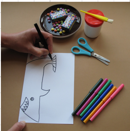
4. teken nu de mond, oogjes en staartvin van de haai