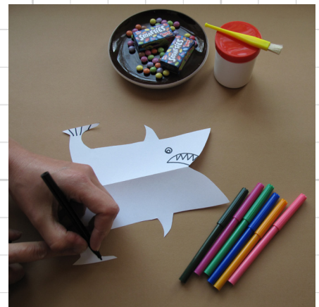
6. vouw de haai open en teken nu op de andere helft ook oogjes etc