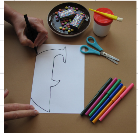
3. teken de omtrek van de haai