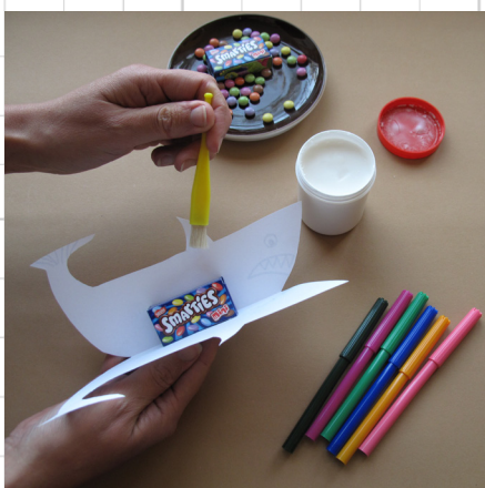
7. lijm het doosje Smarties tussen de twee helften van de haai. Lijm ook de vinnen mee.