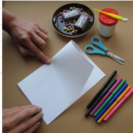
2. vouw het vel in de lengte