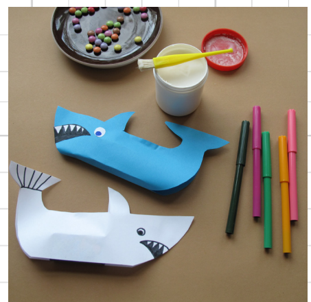
9. je kunt ook gekleurd papier gebruiken!