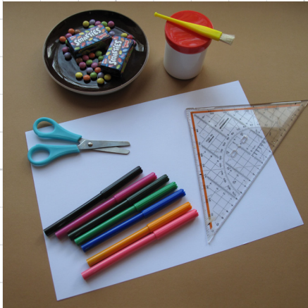
1. pak een leeg A4-vel

Een superleuke en makkelijke traktatie. De kinderen kunnen helpen met plakken.